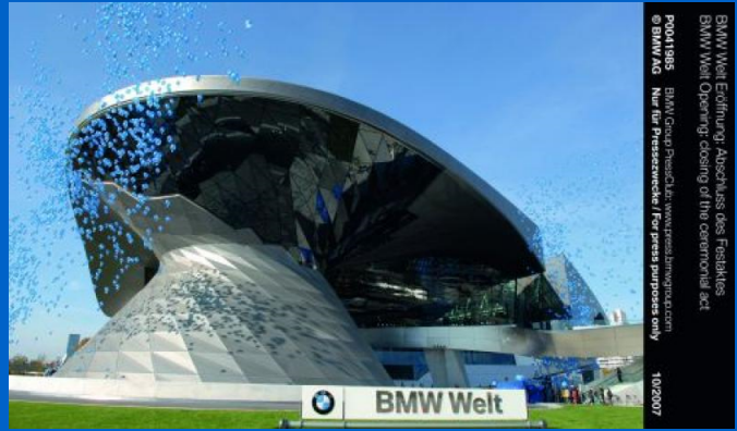
BMW Welt Eröffnung: Abschluss des Festivals. BMW Welt Opening: closing of the ceremonial act. P0041988 Nur für Presseverwecke / For press purposes only. 10/2007