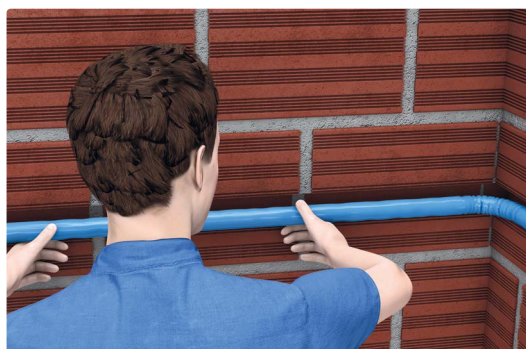
Țevi preizolate Uponor Unipipe Plus