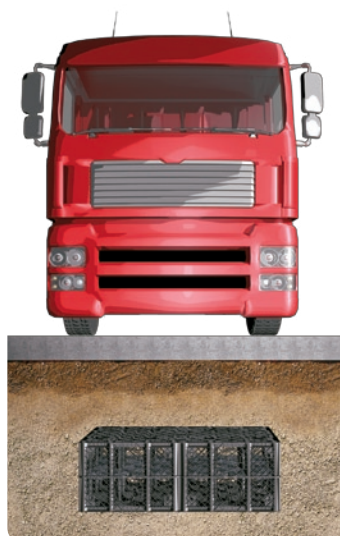
Min. 0,50 m jorddækning ved normal trafiklast