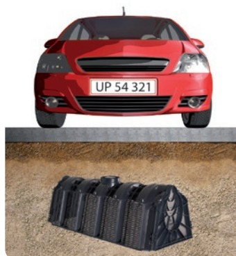
Min. 0,50 m jorddækning ved personvognstrafik

Regnvandskassetten er beregnet til installation i såvel trafikerede som ikke trafikerede områder, mens regnvandstunnellen er beregnet til ikke trafikerede områder og til områder, hvor der maksimalt forekommer personvognstrafik.