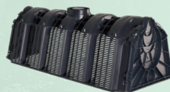
■ Uponor regnvandstunnel