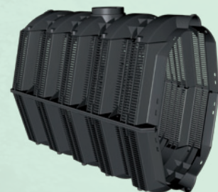
■ Uponor dobbelt regnvandstunnel