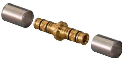
Lisovací spojky Rapex