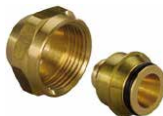
Svěrná šroubení Vario