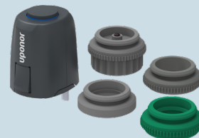
Uponor-toimilaite Uponor Vario Retrofit NC FT 24 V 1 W IP 54 LVI-nro 2022275