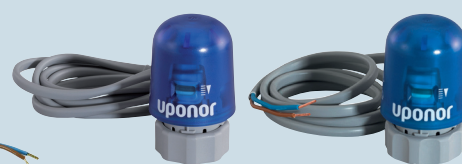
Uponor-toimilaite 24V Vario Plus (muovitukki) LVI-nro 2418961 24V RWG/WGF (messinkitukki) LVI-nro 5398252