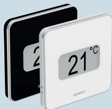
Termostaatti Smatrix Style T-169 LVI-nro 2987818 Valkoinen LVI-nro 2987819 Musta

Termostaatti < näytön kanssa tai ilman > näyttöä