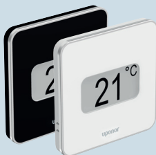
Termostaatti Smatrix Style T-149 LVI-nro 2987813 + 2987815 Valkoinen LVI-nro 2987814 + 2987816 Musta