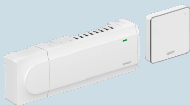
Keskusyksikkö + web-moduuli* Smatrix Wave Pulse Järjestelmän ohjaamiseen Smatrix Pulse -sovelluksella LVI-nro 2988494

Keskusyksikkö < web-moduulin kanssa tai ilman > web-moduulia