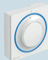
Termostaatti Smatrix T-145 POD LVI-nro 2987782

Termostaatti < näytön kanssa tai ilman > näyttöä