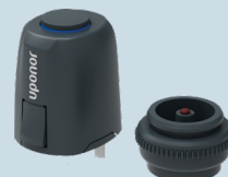
Uponor-toimilaite Uponor Vario NC FT 24 V 1 W IP 54 LVI-nro 2022273

* Huomioi, että toimilaitteen tulee olla 24 V ja jännitteettömästi kiinni (NC) -tyyppinen.