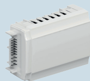
Lisäosa Smatrix Wave Pulse Kuusi lisäkanavaa toimilaitteille ja termostaateille. Käytetään tarvittaessa. LVI-nro 2988496