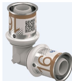
S-Press PLUS PPSU-liitin Koot 16-32 mm