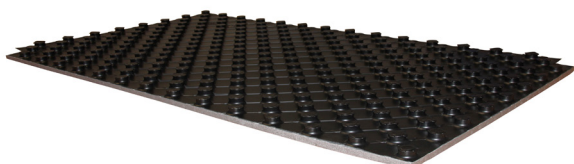
Uponor nubos PLUS