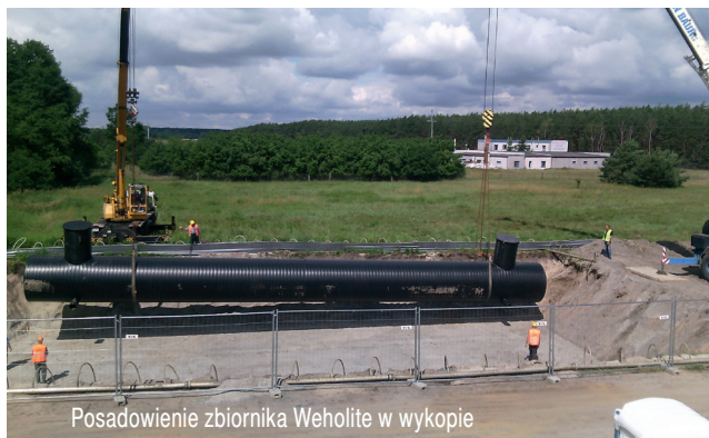
Posadowienie zbiornika Weholute w wykopie

W ramach realizacji drugiego i trzeciego odcinka zaplanowano budowę kanalizacji deszczowej oraz modernizację istniejącej sieci odwodnieniowej. Kanalizacja deszczowa obejmowała rury PP SN 10 kN/m 2 , rury PE-HD SN 8 kN/m 2 wraz ze studniami kanalizacyjnymi o średnicach DN 1000–DN 3000, system studzienek wpustowych DN 500 oraz urządzenia podczysz-