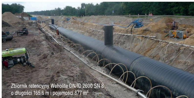
Zbiornik retencyjny Weholite DN/ID 2600 SN 8 o długości 165,6 m i pojemności 877 m 3