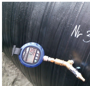
Badanie szczelności zbiornika Weholite

Prace montażowe zbiorników odbywały się w bardzo szybkim tempie od czerwca do września 2016 r. Z uwagi na ograniczenia i intensywność harmonogramu prac drogowych trwały do późnych godzin nocnych. Instalacja baterii sześciu zbiorników z zadania drugiego wraz z próbą szczelności trwała osiem dni, baterii pięciu zbiorników z zadania trzeciego – siedem dni, a najdłuższego zbiornika – 15 dni. Montaż największej baterii