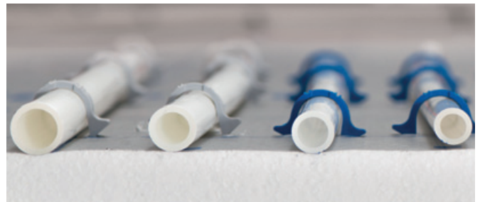
Na voljo sta dve vrsti cevi v več različnih dimenzijah