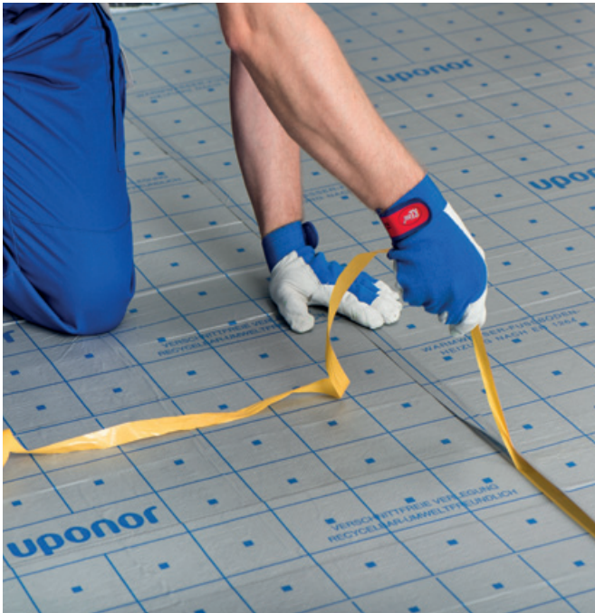
Samolepilni trak vzdolž plošče za hitro vodotesno povezovanje stikov plošč – samo odlepite varnostni trak in pritisnite teksturno folijo na podlago