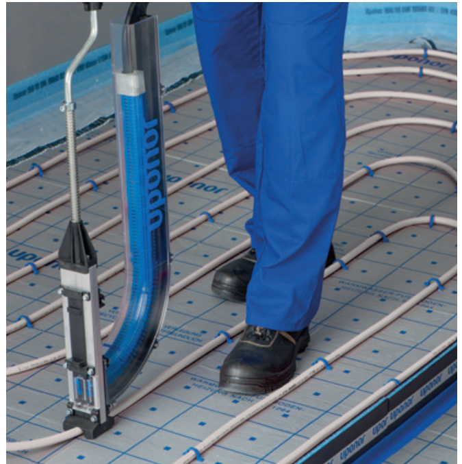
Hitra vgradnja cevi s pomočjo cevnih pritrdilcev Uponor Tacker in posebnega orodja

Naš sistem Uponor Tacker je sistem, ki se prekrije z estrihom in ki zagotavlja, da se vsaka komponenta odlično prilega eni drugi. Glavne komponente sistema Uponor Tacker in njihove značilnosti: