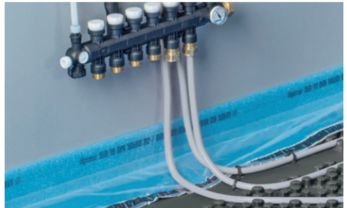
Pritrjevanje cevi pred razdelilno omarico.

Samolepilni Uponorjev razmejitevni profil zagotavlja varno vgradnjo pri vratnih odprtinah. Cevi so pri vratnih odprtinah peljane skozi zaščitno Uponorjevo cevjo.