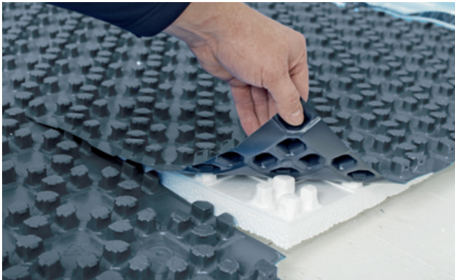
Kombinacija izolacijskega PS sloja in črne sistemske plošče.

Izolacijski sloj pod črno sistemsko ploščo s čepki utrdijo čepke in zanesljivo fiksirajo cevi na mesto.