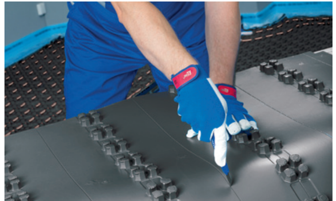
Dodatne plošče za vratne odprtine in površine ob razdelilnih omaricah.

Izolacijski sloj pod črno sistemsko ploščo s čepki utrdijo čepke in zanesljivo fiksirajo cevi na mesto.