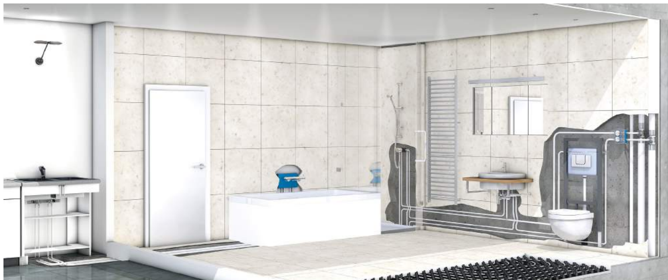
Okruhová inštalácia (malý rádius) pre kuchynské a kúpeľňové zostavy

Môžete si vybrať ten správny variant Uni Pipe PLUS kompozitných potrubí pre vaše presné potreby na pracovisku – ako dodávku v kotúčoch alebo v tyčiach, predizolované alebo "rúrka v rúrke". V prípade, že máte záujem dozvedieť sa viac o všetkých výhodách a možnostiach pre Vás, radi Vám poskytneme osobnú pomoc.