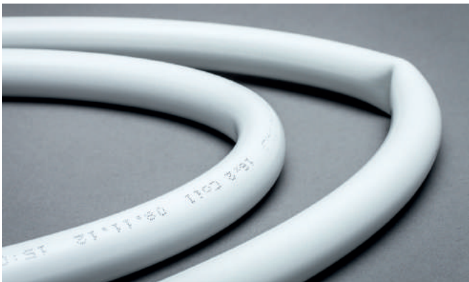
Porovnanie starej a novej rúrky Uni Pipe PLUS