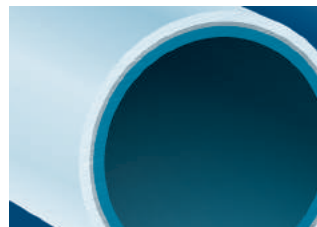
Uni Pipe PLUS