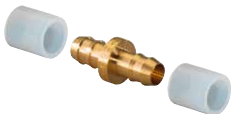
Q & E savienojums

Uponor smeļas iedvesmu dabā — tā atjautīgie inženiertehniskie risinājumi veido lieliskas struktūras, kas spēj izturēt mehānisko slodzi ar minimāliem izejmateriāliem un enerģijas patēriņu. Evolūcijas gaitā pilnveidošanās process skar vissīkākās detaļas.