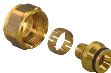
Vario kompresijas veidgabali