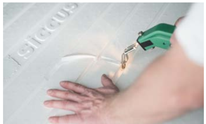
Profesionalni alat za precizno rezanje

Polistiren ploča može se s lakoćom prilagoditi bilo kojem tlocrtu zahvaljujući sustavu spajanja ploča krajnjim zglobovima. Ako su potrebne dodatne vodilice, mogu se jednostavno izraditi u nekoliko minuta s pomoću električnog rezača.