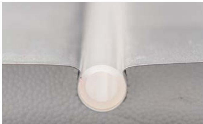
Al-ploča za prijenos topline ima oblik grčkog slova omega čime je osiguran savršen prijenos topline