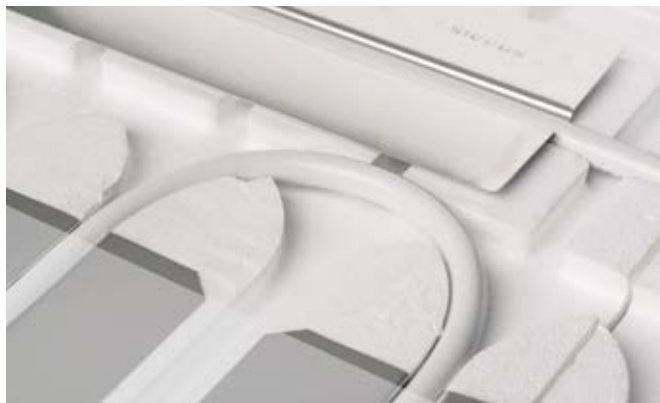
Samo četiri dijela: polistiren ploča, Al-ploča za prijenos topline, cijev za grijanje, PE folija

Vodilice u Siccus pločama služe za učvršćivanje Al-ploča za prijenos topline i cijevi za grijanje. Polistiren ploča je savitljiva, lako se reže i isporučuje se s vodilicama koje su utisnute u „gornjoj plohi” i koriste se za polaganje Uponor PE-Xa i MLC cijevi.