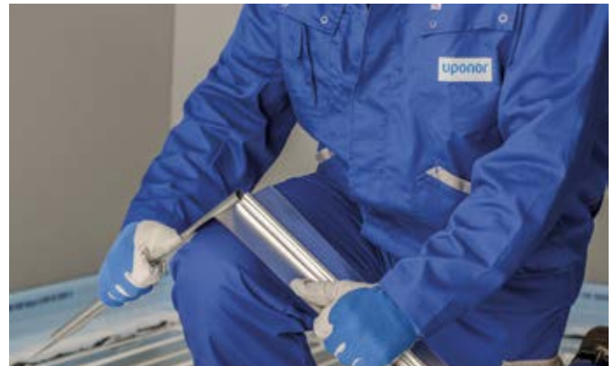
Al-ploča za prijenos topline lako se dijeli na manje dijelove jednostavnim savijanjem

Uponor Siccus može se ugraditi s tri različite cijevi, ovisno o vašim potrebama: Uponor PE-Xa, crvenom Uponor MLCP i bijelom MLCP. Neovisno o tome za koju se kombinaciju odlučite, sve osiguravaju idealnu veličinu kruga grijanja, visinu i savitljivost konstrukcije.