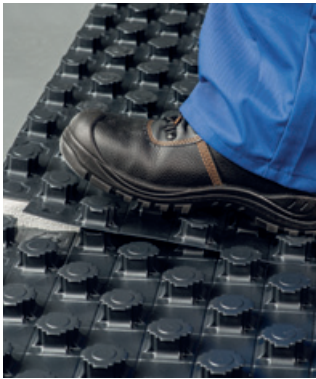
Natančno polaganje in spajanje brez potrebe po dodatni pomoči

Za spajanje sistemskih plošč na mestu, kjer se stikata dve plošči, uporabite samo svojo lastno nogo, in to je vse! S tem prihranite čas in denar.