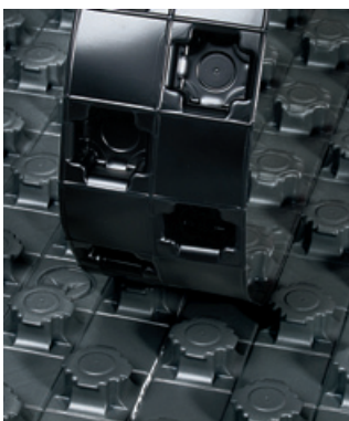
Dvostranski trak nudi še boljše fleksibilnost

Najboljši del sistemske plošče Tecto je prav gotovo pritrdilni čepek. Ob robovih plošče se nahajajo mini/maksi čeпки, ki zagotavljajo čisto vgradnjo, istočasno pa tudi optimalno tesen spoj zahvaljujoč prekritju.