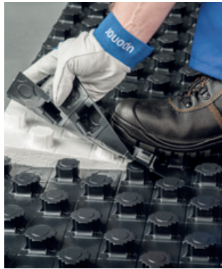
Prekrivni del plošče omogoča varno in enostavno vgradnjo

Za spajanje sistemskih plošč na mestu, kjer se stikata dve plošči, uporabite samo svojo lastno nogo, in to je vse! S tem prihranite čas in denar.