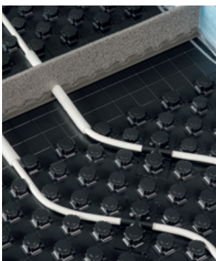
Dilatacijski razmejitveni profil za vodenje cevi preko vratnih odprtini

Ker kompenzacijski element nima nobenega čepeka na njegovem ravnem delu, lahko fleksibilna ogrevalna cev sama določi svojo pot. Vratne odprtine so hitro zapolnjene, tako da je problematika ujemanja vratnih odprtini stvar preteklosti.