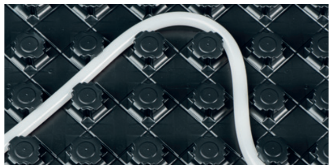
Možni so tesno se prilegajoči radiji krivljenja