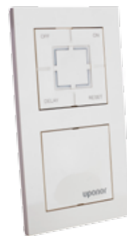
Betjeningspanel for Uponor Waterguard Vannstoppssystem.