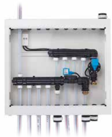
Fordelerskap med Uponor Q&E Fordeler PPM med magnetventiler for Uponor Waterguard Vannstoppssystem.

Frontpanelet har fire knapper som alle har forskjellige funksjoner: - ON = åpner magnetventilene, - OFF = stenger magnetventilene, - RESET = resetter systemet etter en sensorutløsning - DELAY = 3 timer forsinkelse på avstengning av magnetventiler.