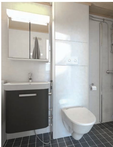
Centrerad kassett med ytskikt av plåt.

Uponor Reno Port Våtrumskassett optimerar byggprocessen. Hög prefabriceringsgrad spar tid på plats, då installatören endast gör ett fåtal avslutande kopplingar.