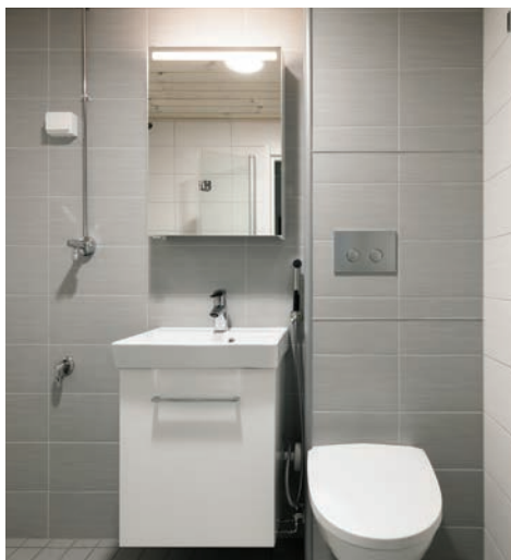
Hörnplacerad kassett med kaklad yta.