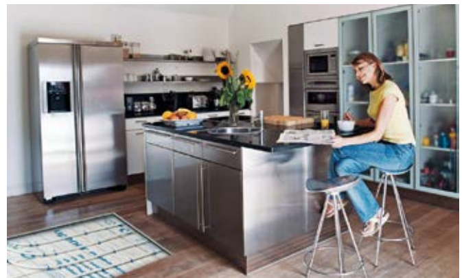
Puno topline i iznimna udobnost; Uponor Classic osigurava jednoliko grijanje unutrašnjosti prostorija svih veličina i oblika.

“ Visoka kvaliteta sastavnih dijelova jamči savršeno polaganje uz niske troškove. ”