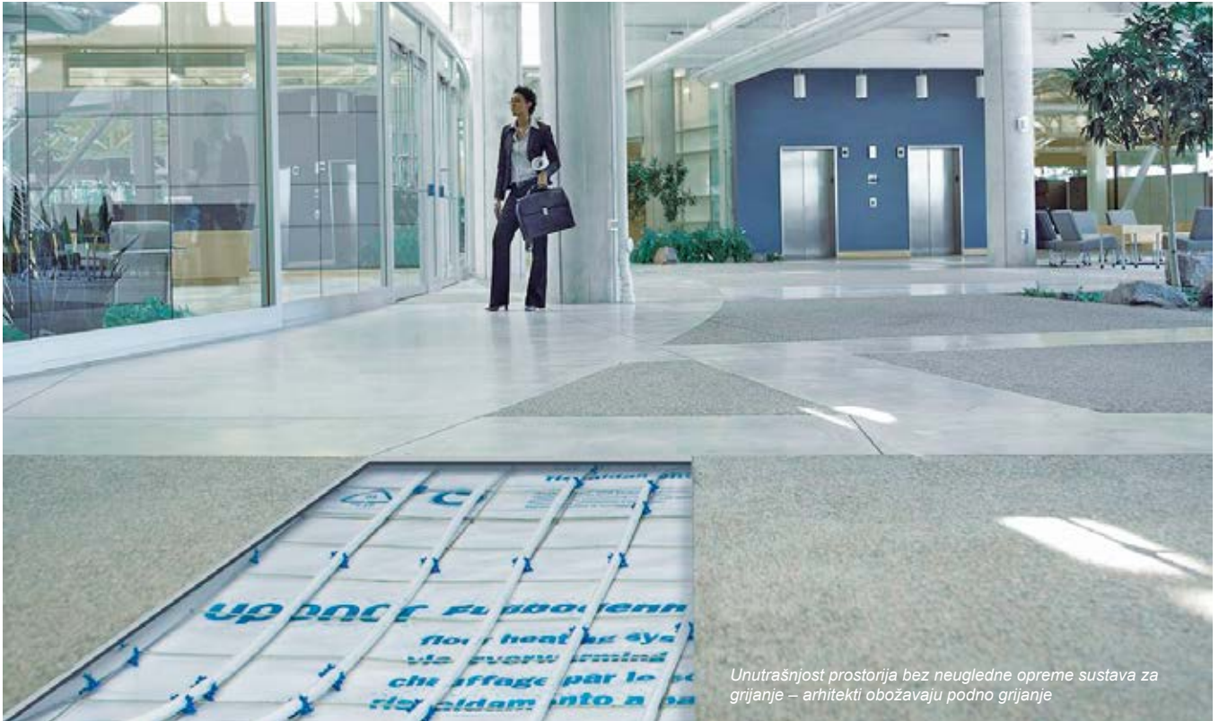
Unutrašnjost prostorija bez neugledne opreme sustava za grijanje – arhitekti obožavaju podno grijanje