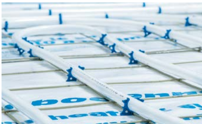
Polumjer savijanja = 8,5 cm (17 x 2 mm)