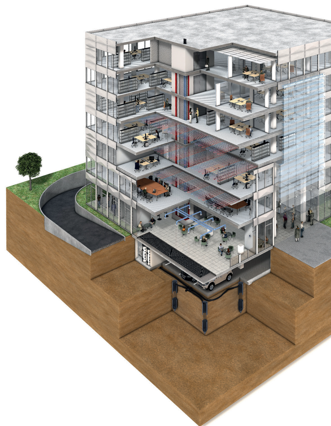
Uponor Smatrix PRO 13