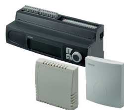
Unitate de comandă pentru alimentarea cu agent termic Smatrix Move PRO