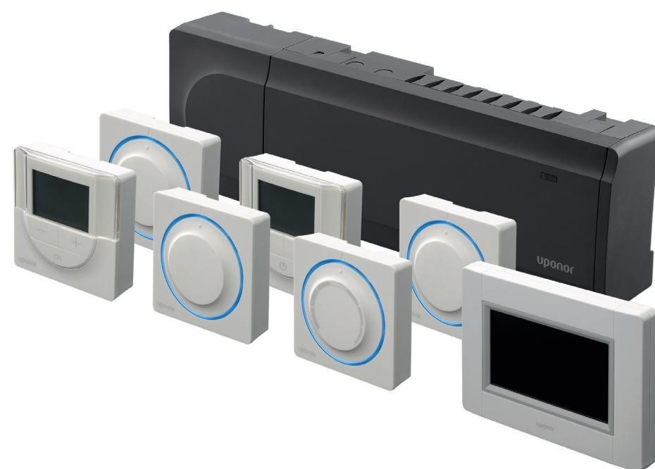
Smatrix Base PRO, având funcție de autoechilibrare și integrare ușoară în B.M.S.

Smatrix Base PRO gestionează perfect clădirea dvs. comercială – acest sistem centralizat controlează diferitele temperaturi din numeroasele zone ale clădirii. Un ecran tactil și un meniu prietenos cu utilizatorul permit oricui să utilizeze o tehnologie avansată de control la distanță, datorită unui algoritm de autoînvățare. Cu toate acestea, Smatrix Base PRO este perfect capabil să răspundă automat la necesitățile diferitelor încăperi.