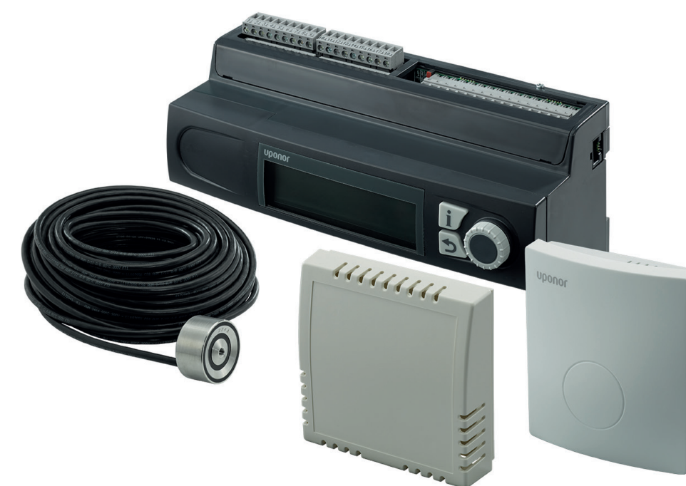
Smatrix Move PRO, având și funcții de degivrare și de preparare apă caldă menajeră.

Smatrix Move PRO reprezintă un sistem complementar ultramodern pentru Smatrix Base PRO, îmbunătățindu-l considerabil. Senzorii speciali permit gestionarea alimentării cu agent termic pentru mai multe zone de încălzire, răcire sau degivrare exterioară. Accesul la tehnologia viitorului nu a fost niciodată atât de ușor, deoarece Smatrix Move PRO poate fi integrat în sistemele deja existente de B.M.S.