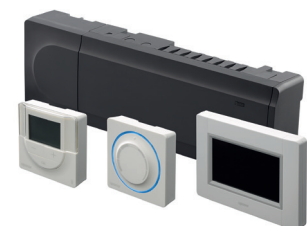
Unitate de comandă multi-cameră Smatrrix Base PRO

Ușor de instalat, configurat și utilizat. Un singur partener de contact pentru toate nevoile dvs.