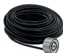
Sisteme de degivrare