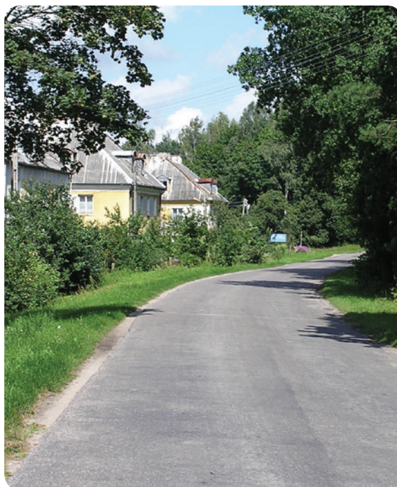
Ultra Classic passer like bra på landsbygda som i storbyen.

Akkurat som det er forskjeller fra et rør til et annet, er det forskjeller mellom plast og plast. Derfor har vi i Uponor av miljø- og kvalitetsårsaker valgt i størst mulig grad å arbeide med plasten polypropylen (PP) i rørene og produktene våre. PP har lang levetid, samt svært god slagfasthet og temperaturbestandighet. Dessuten kan PP gjenvinnes, både ved å males opp og smeltes om